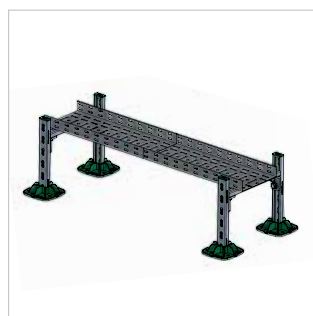
■ Support pour chemin de câble