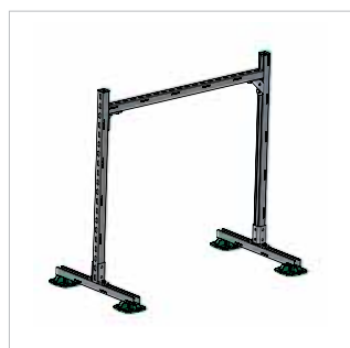
■ Support pour conduits d'aération