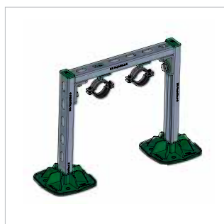
■ Support pour tubes