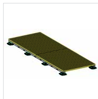
■ Cheminement sur grilles