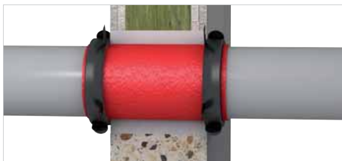
Ingebouwde situatie in massieve en lichte scheidingswanden \geq 100 mm