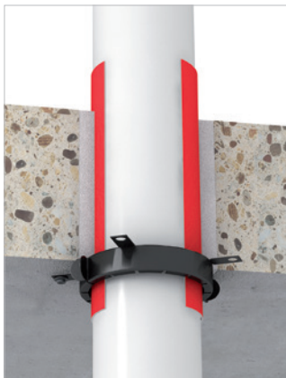
Met PE-isolatie \leq 9 mm T-verbinding dicht bij de doorvoer (of \leq 32 mm synthetische rubberisolatie).