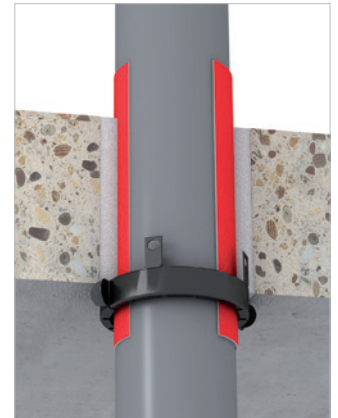
Bevestigingshaken ingemetseld (90° omgedraaid).