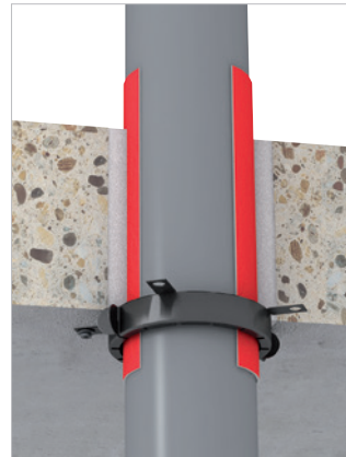
Brandbare leidingen tot een buitendiameter van 200 mm.