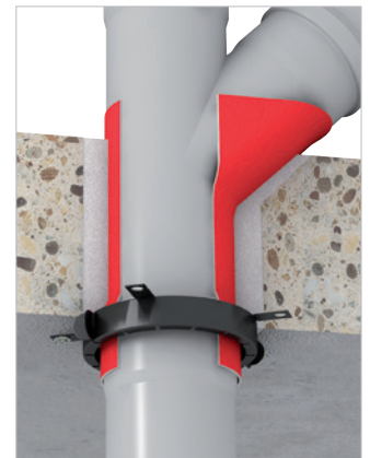
T-verbinding dicht bij de doorvoer.