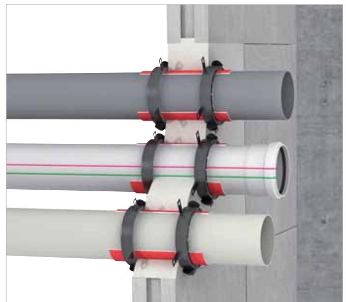
Opening met optionele geluidsisolatie