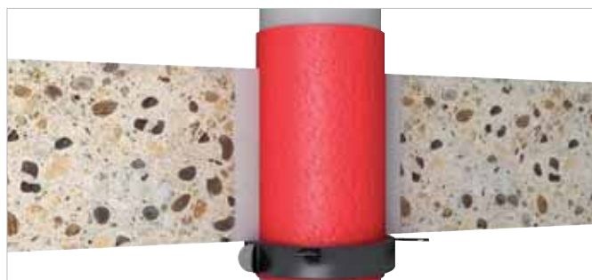
Ingebouwde situatie in plafonds \geq 150 mm