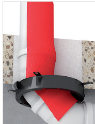
Buigt direct onder het plafond.