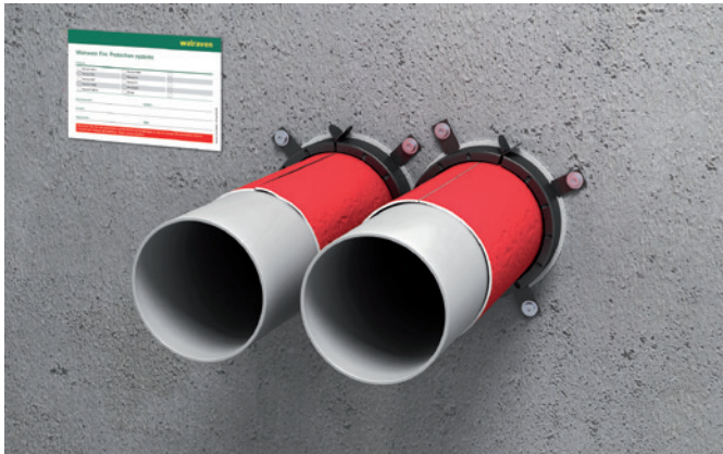
Nulafstand mogelijk tussen de manchetten.