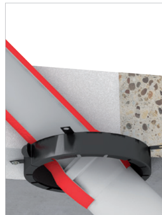
Ook geschikt voor diagonale doorvoeringen.