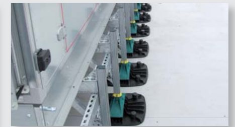
Holiday Inn hotel – Benoa, Bali, Indonesien