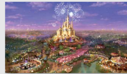
Disney Resort – Shanghai, Kina