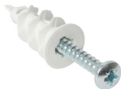
WRX PP 14x32