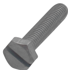
614 3 6XX