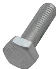
614 3 XXX