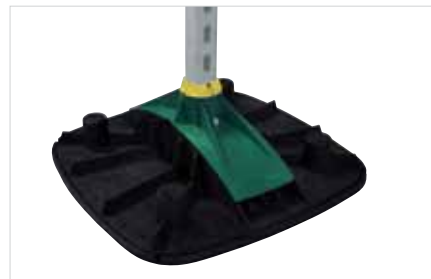
■ BIS Yeti® Montagesysteem (BUP 1000)

Onze producten voldoen aan specifieke kwaliteitseisen die vereist zijn voor bepaalde toepassingen