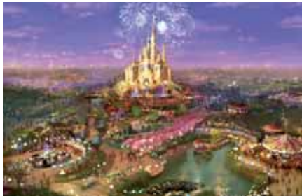
Shanghai – China / Disney Resort