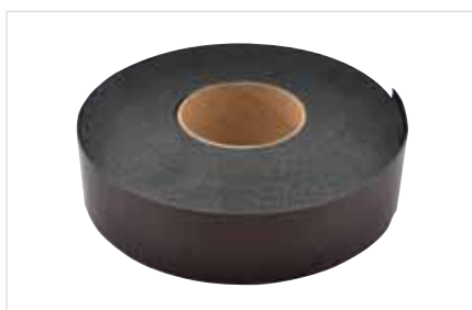
■ BIS Pacifyre® IWM III Brandwerend Band