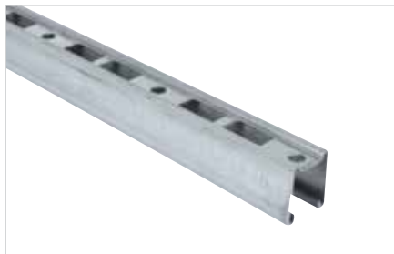
■ BIS RapidStrut® Montagerail DS 5 (BUP 1000)

Innovatieve oplossingen voor mechanische en elektrotechnische installaties