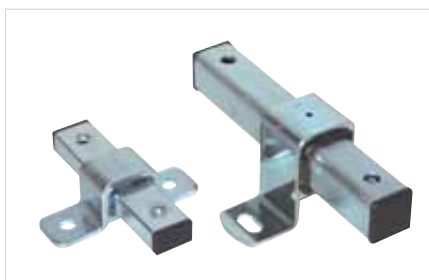
■ BIS Expansieschuifstuk (BUP 1000)