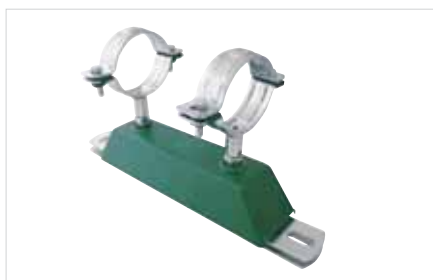
■ BIS dB-FIX® 200 Vastpuntconsole