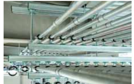
Bratislava – Slowakije / Bory Mall