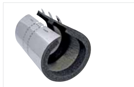
■ BIS Pacifyre® MK II Brandmanchet