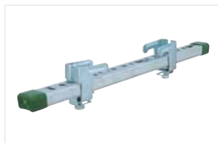
■ BIS Rail WM0 'Light Duty' Set

Onze producten voldoen aan specifieke kwaliteitseisen die vereist zijn voor bepaalde toepassingen