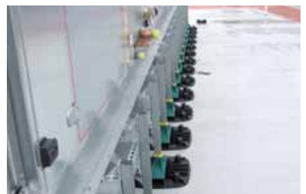
Benoa – Bali – Indonesië / Holiday Inn Hotel