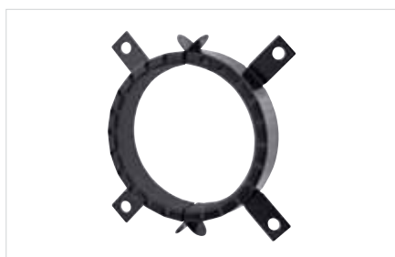
■ BIS Pacifyre® AWM III Brandmanchet