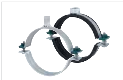
■ BIS HD Zware Beugel 500 en 1501 (BUP 1000)