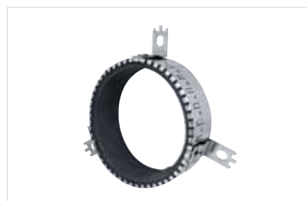
■ BIS Pacifyre® EFC Brandmanchet