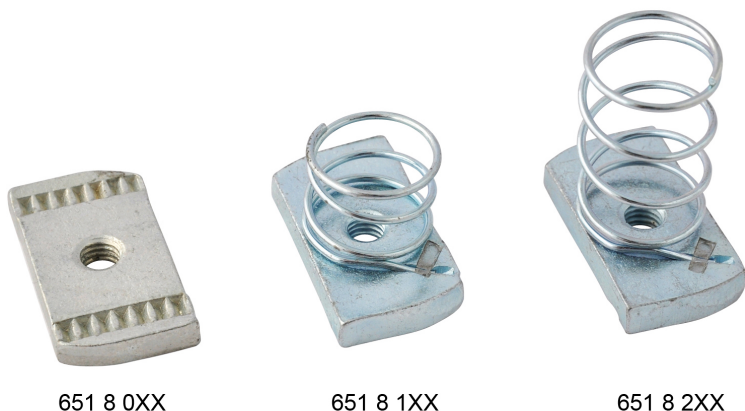
651 8 0XX