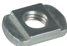
651 9 0XX