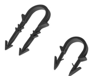
087 0 1XX