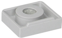
085 4 XXX