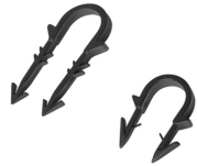
087 0 1XX