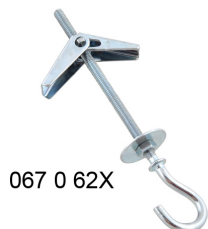
067 0 62X