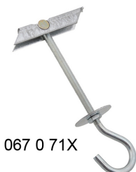
067 0 71X