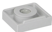
085 4 XXX