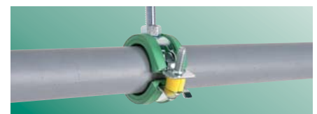
Dokręć śrubę by domknąć obejmę