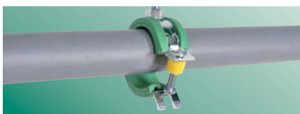
Założ obejmę na rurę

Testowane, certyfikowane i monitorowane przez jednostkę zewnętrzną zgodnie z RAL-GZ 655/B. By uzyskać więcej informacji o RAL zobacz strony informacyjne RAL w katalogu internetowym na: walraven.com