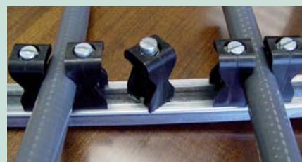
Легкий и быстрый монтаж к профилю