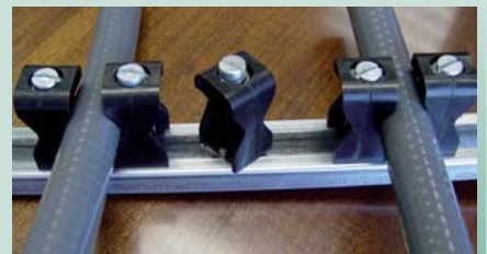
Lätt att montera på skena