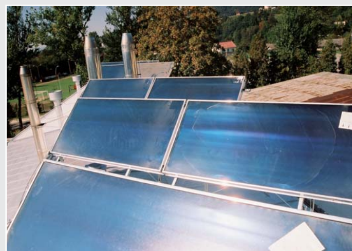
Zonnecollectorinstallatie - Bedrijfsgebouw - Myślenice (PL)