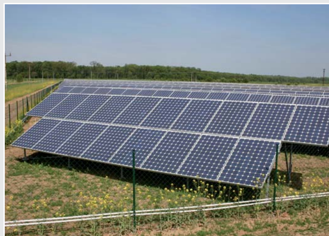
Fotovoltaïsche zonne-energieinstallatie - Vnorovy (CZ)