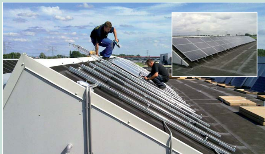
Fotovoltaïsche zonne-energieinstallatie - Distributiecentrum - Bleiswijk (NL)