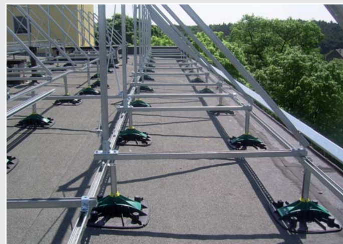
Zonnecollectorinstallatie - Ziekenhuis - Barlinek (PL)