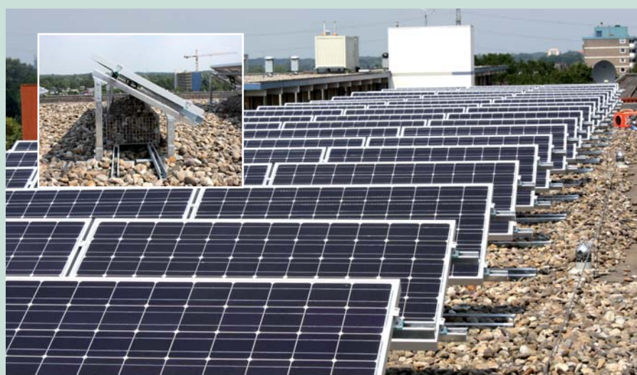
Fotovoltaïsche zonne-energieinstallatie - Appartementencomplex Enschede (NL)