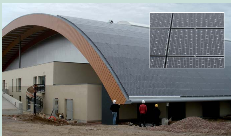
Fotovoltaïsche zonne-energieinstallatie - Sporthal - Arques (FR)