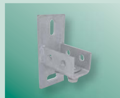
BIS Plaque murale Strut (lourd)