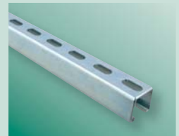
BIS RapidStrut® Rail