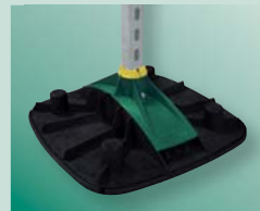
BIS Yeti Système de supportage