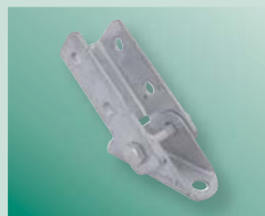
BIS Reinfort de liaison Strut