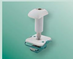
BIS RapidStrut® Fixation panneaux solaires