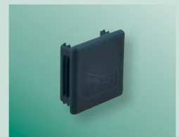
BIS Bouchon de finition Strut