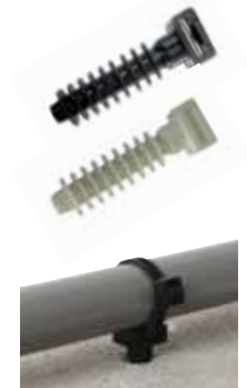
■ Hmoždinka pro stahovací pásek