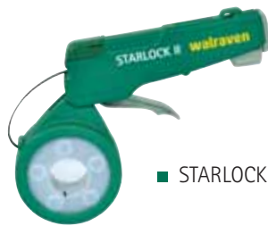
■ STARLOCK II