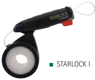
■ STARLOCK I