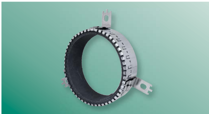
BIS Pacifyre® EFC tűzvédelmi mandzsetta Rugalmas, előregyártott mandzsetta a csőnyílások füst és tűzbiztos lezárására.