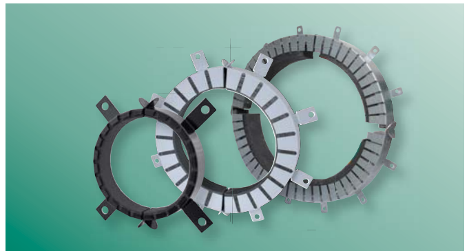
BIS Pacifyre® AWM III Egykomponensű előregyártott mandzsetta a csőnyílások füst és tűzbiztos lezárására.