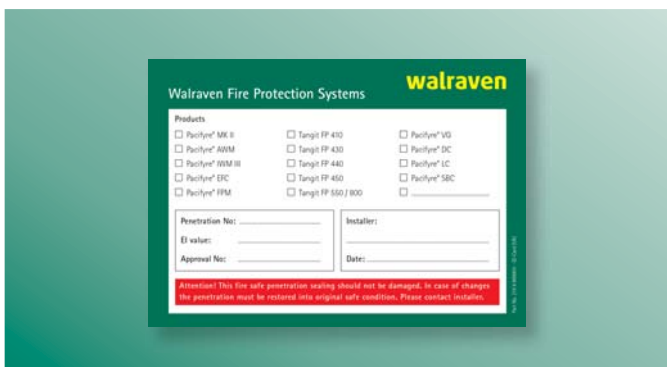
BIS Pacifyre® Információs tábla Jelzésre, azonosítási és ellenőrzési célból. Minden BIS Pacifyre® csőáttöréshez.