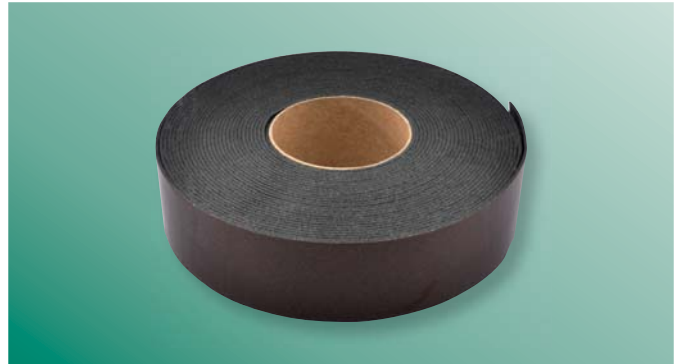
BIS Pacifyre® IWM III tűzvédelmi szalag Tűzvédelmi szalag a csőnyílások füst és tűzbiztos lezárására.