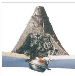
Après le feu