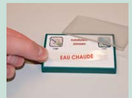
Avec plaque transparente pour étiquetage manuel