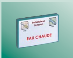
Application directe sur mur