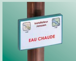
Fixation sur tuyau