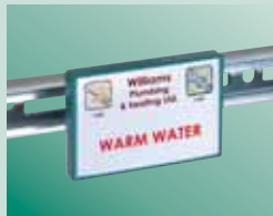
Fijado en carriles