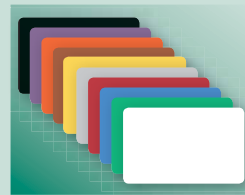
Disponible en 10 colores