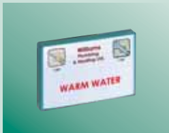
Fijado en paredes