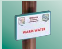
Fijado en tuberías