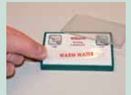
Con cubierta plástica transparente para hacer tus propias etiquetas